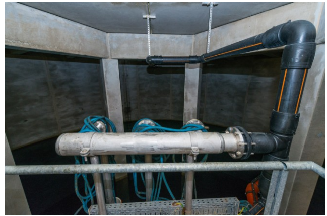
Zisterne zur Regenwassernutzung, Olympiastadion Berlin