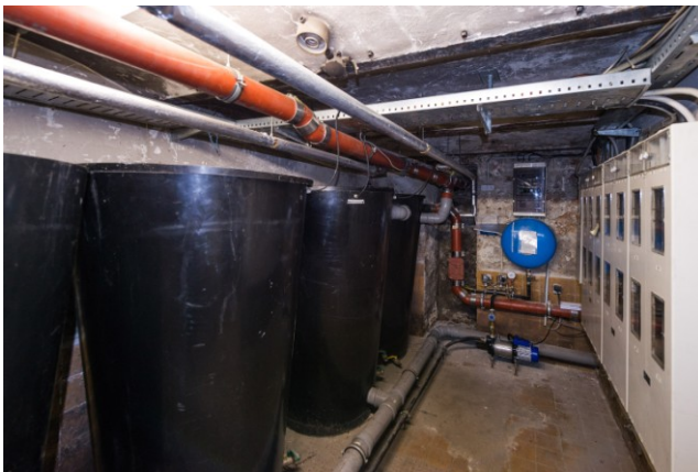
Zisterne zur Regenwassernutzung, Weibervirtschaft eG, Berlin